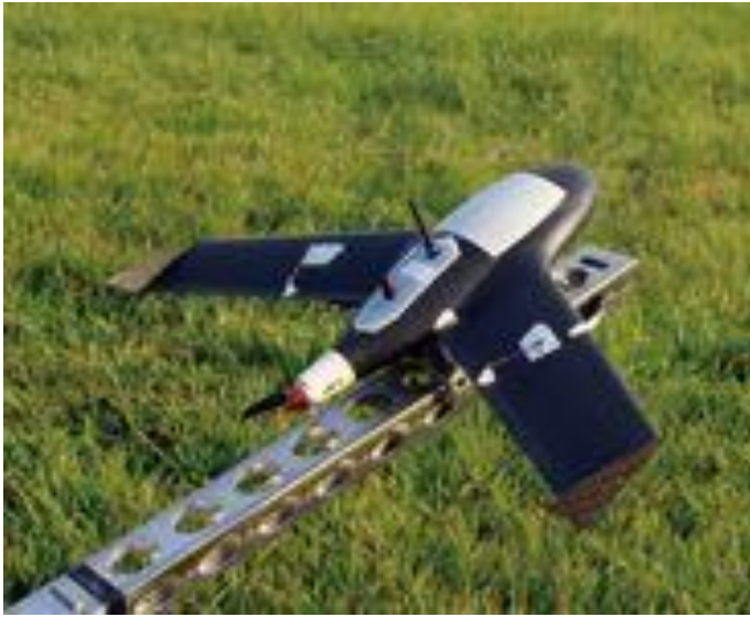
機材 Gatewing x100