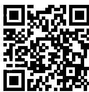
詳細・WEB 申込ページ